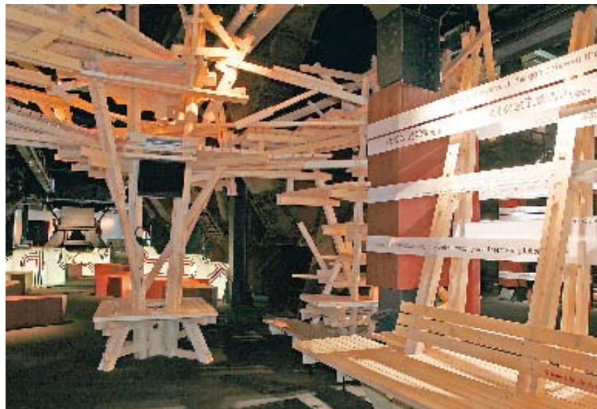
90 Sekunden dauert die Fahrt mit der 56 Meter langen frei stehenden Rolltreppe vom Zechengelände bis hinauf in die Ebene 24 der Kohlenwäsche. Oben der Blick in die Ausstellung „Talking Cities“ auf Ebene 17;